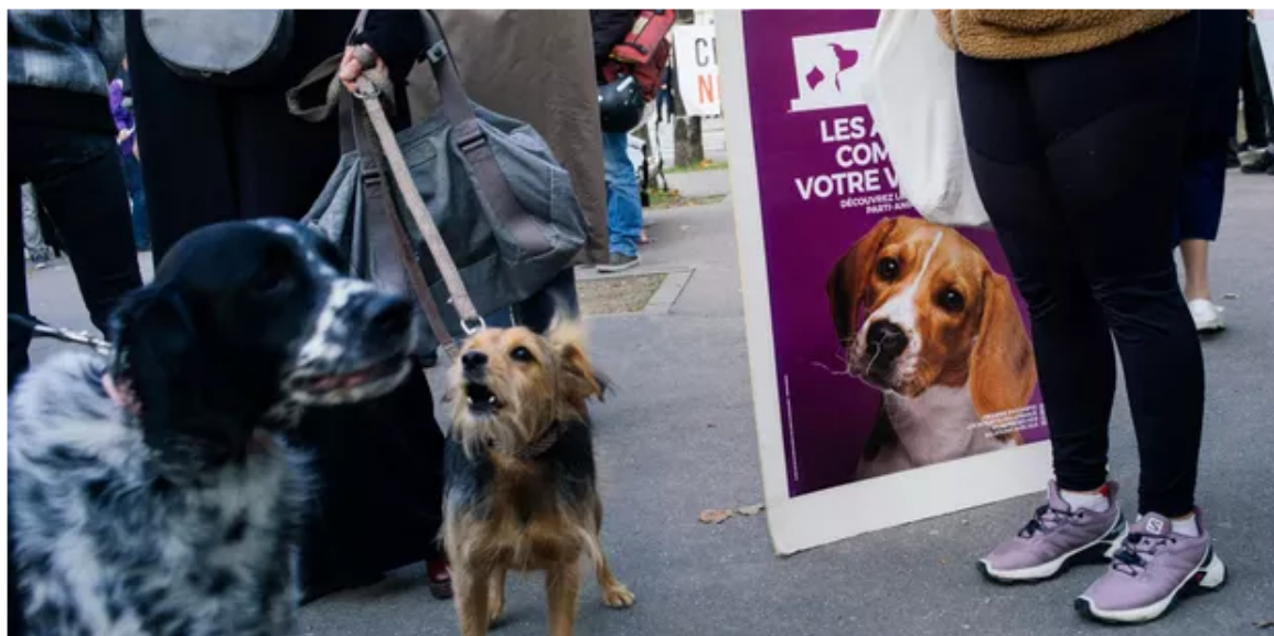
Manifestation des défenseurs des animaux aux abords de l'Assemblée nationale le 14 octobre 2020.

Dans une lettre ouverte adressée au gouvernement, 43 ONG et 30 parlementaires, parmi lesquels Cédric Villani, Aurore Bergé ou Laurence Rossignol, demandent la mise à l'ordre du jour du Sénat de la proposition de loi contre la maltraitance animale, votée à l'Assemblée nationale le 29 janvier.